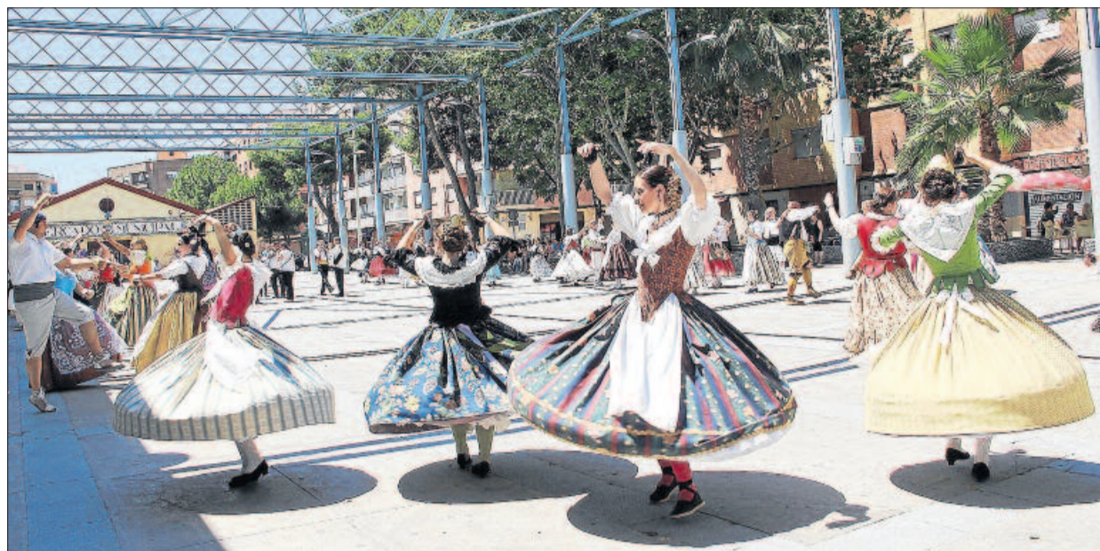
El grup de danses de Manises compleix enguany 25 anys des de la seua creació.